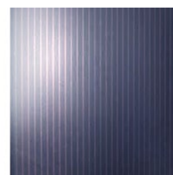
Tyndfilm (amorft silicium, CIS, CdTe)

Moduler med krystallinsk silicium er de ældste, mest udbredte og mest effektive solceller. De kendes på den typiske inddeling i et antal firkantede celler på størrelse med en stor håndflade.